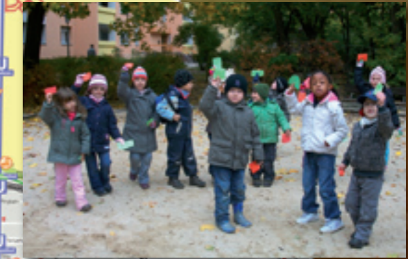
Innenseite des Stadtplans mit dem nördlichem Teil des Bezirks und der Legende. (großes Bild oben) Rote oder grüne Karte? Kitakinder bewerten einen Spielplatz. (kleines Bild oben)