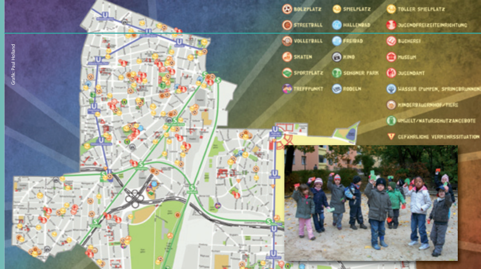
Grafik: Paul Holland