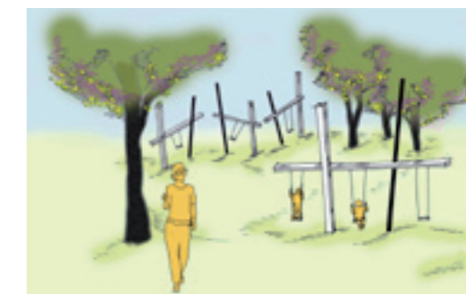
Schaukelwerk in der Bewegungswelt

Ziel der Bewegungswelt ist es unter anderem, älteren Kindern und Jugendlichen nachhaltig eine frei bespielbare eigene Welt in Stadtnähe anzubieten. ■