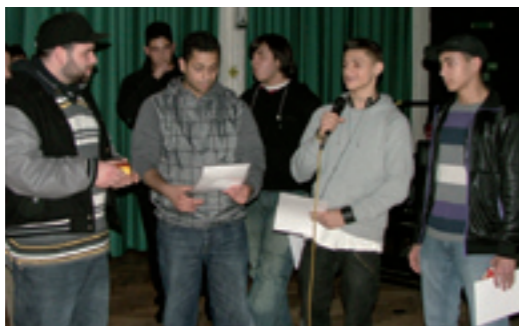
Teilnehmer der Jugendjury verkünden ihre Preisentscheidung im November 2009 im Haus der Jugend am Nauener Platz in Berlin.

Im Projekt „Nauener - was geht?“ haben Jugendliche in Streifzügen, Diskussionen und Interviews Ideen entwickelt, wie Angebote für sie auf dem Platz, in den Jugendfreizeiteinrichtungen und im Quartier verbessert werden können. Das Beteiligungsverfahren wurde im ExWoSt-Programm, Baustein „Jugendliche im Stadtquartier“ im Zeitraum August 2009 bis Februar 2010 gefördert. INTEGERE wurde vom Bezirk Berlin-Mitte mit der Vorbereitung und Durchführung des Beteiligungsverfahrens beauftragt.