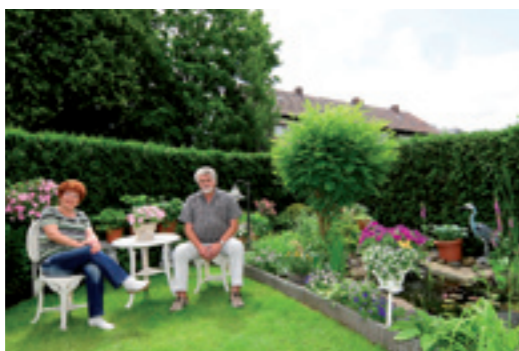
Gartenglück in der Großstadt präsentierten dieses Ehepaar den Fotografen.

Diesen „Quartiersstolz“ kehrte das Quartiersmanagement Bickern/Unser Fritz im Jahr 2009 nach außen. Mit ehrenamtlicher Unterstützung von sieben Mitgliedern des Foto-Film-Clubs Wanne-Eickel porträtierte es 28 Bewohner aus Bickern/Unser Fritz in