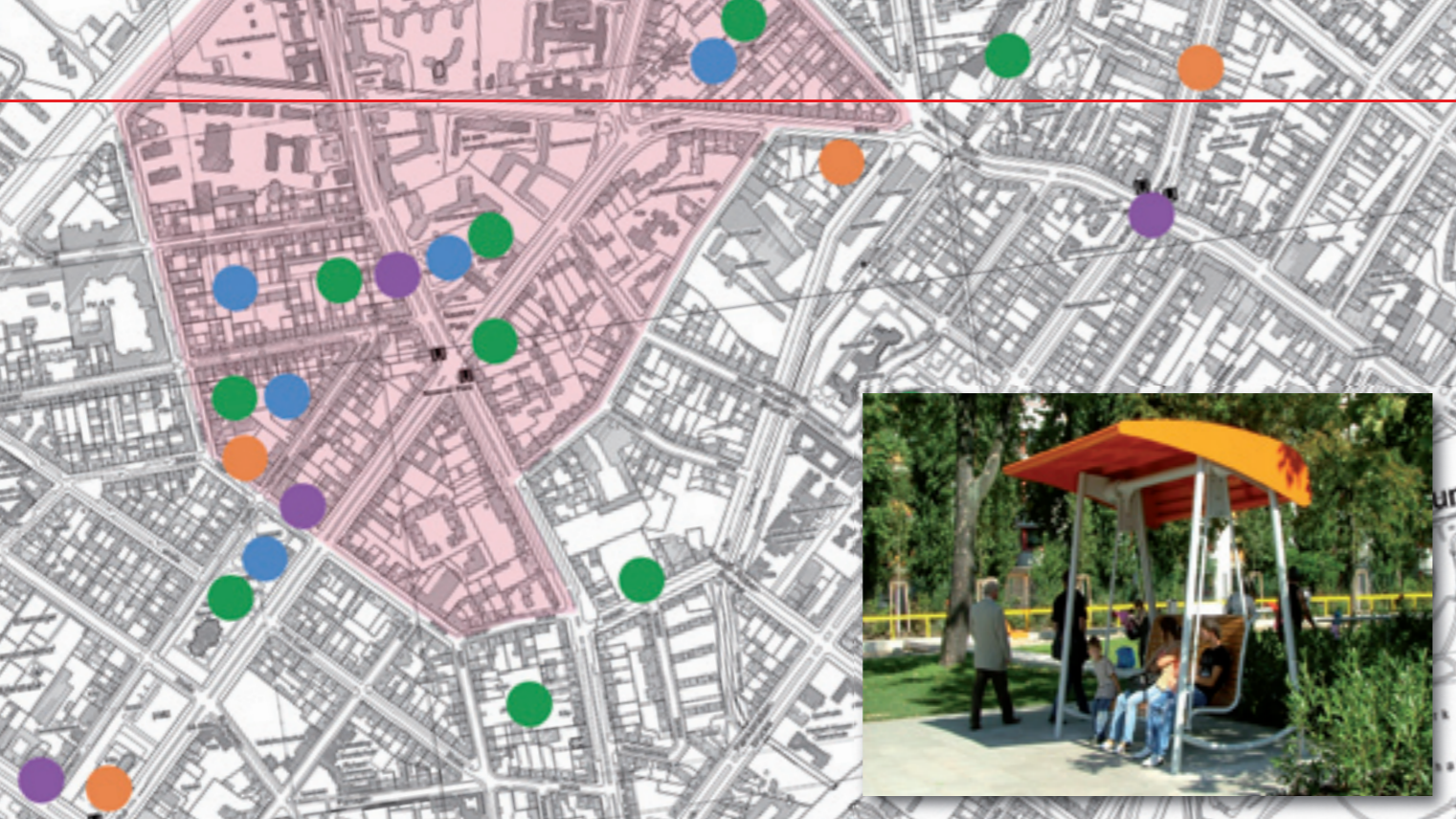
Treffpunkte von Jugendlichen im Quartier Nauener Platz, Berlin, Ergebnis von Befragungen Herbst 2009 (großes Bild). Beliebte Hollywoodschaukel auf dem neugestalteten Nauener Platz (kleines Bild).